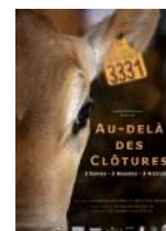
Association Les Du-TERRÉmines Lauréat 2020

Etude des conséquences du changement climatique sur les glaciers des Alpes françaises et autrichiennes.