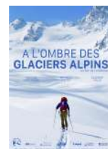
Association Cordilleras Lauréat 2021

Portraits d'agriculteurs des Balkans, de Turquie et de Géorgie partageant leurs méthodes d'agroforesterie, leur quotidien et leurs craintes face aux métamorphoses de l'économie et du climat.