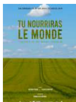
Association Paroles de Paysans Lauréat 2022

Portraits de céréaliers champenois pour comprendre l'origine des freins à la transition agroécologique.