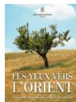
Association Sous l'Ombre de l'Arbre Lauréat 2021

Portraits de céréaliers champenois pour comprendre l'origine des freins à la transition agroécologique.