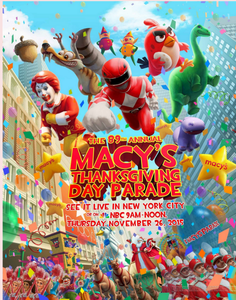
La Macy's Thanksgiving Day Parade est un cortège annuel créé par la chaîne de magasins américaine Macy's. Le défilé, d'une durée de trois heures, se tient à New York le quatrième jeudi de novembre

L'histoire commence à la fin du XIXème siècle : les parades pour fêter la fin de Thanksgiving et l'arrivée de Noël sont sponsorisées par les grands magasins, qui les utilisent pour faire de la publicité. C'est ainsi que le vendredi suivant la fin de Thanksgiving devint le début officiel des courses de Noël.